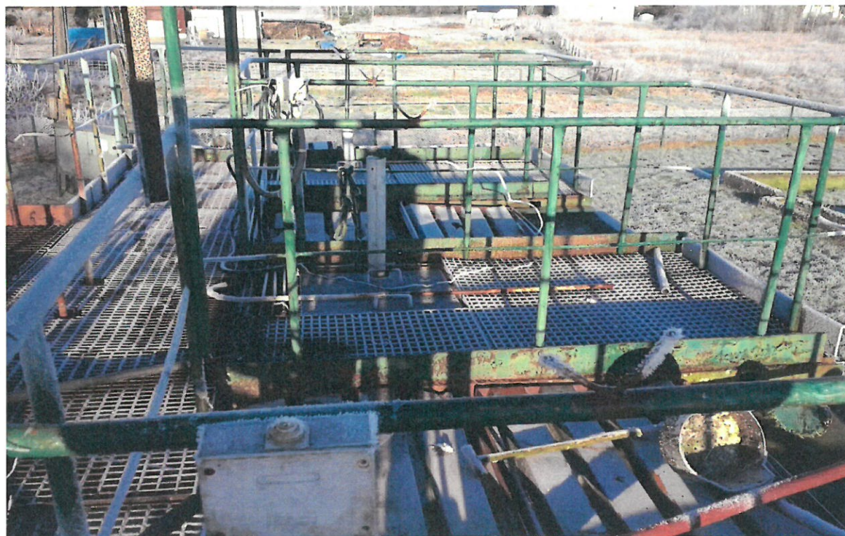
Fot. nr 4. BIOBLOK MUm75 pomost obsługowy (+ 2,65 n.p.t.)