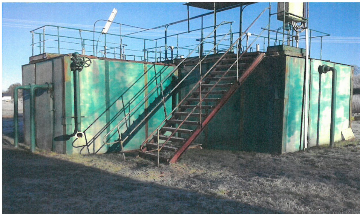
Fot. nr 2. BIOBLOK MUm75 elewacja SW