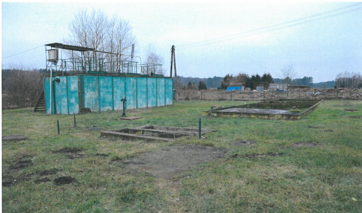
Fot. nr 1. BIOBLOK MUm75 elewacja NE, komora krat, poletka osadowe