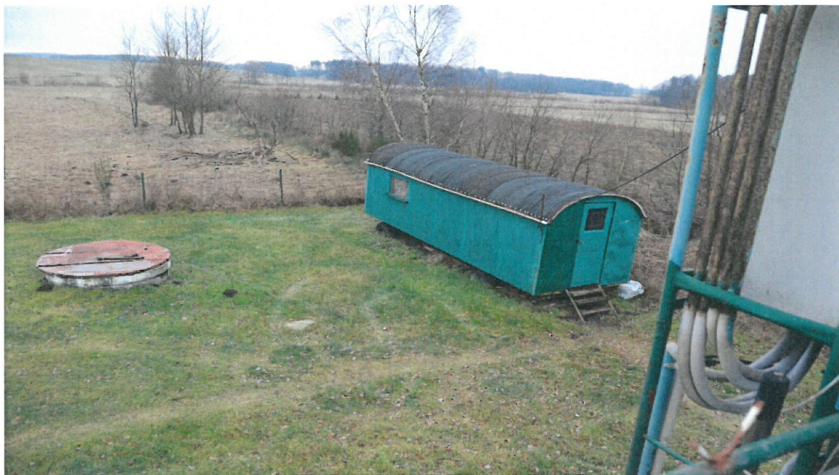
Fot. nr 5. Widok z pomostu na barak magazynowy i pompownię ścieków surowych