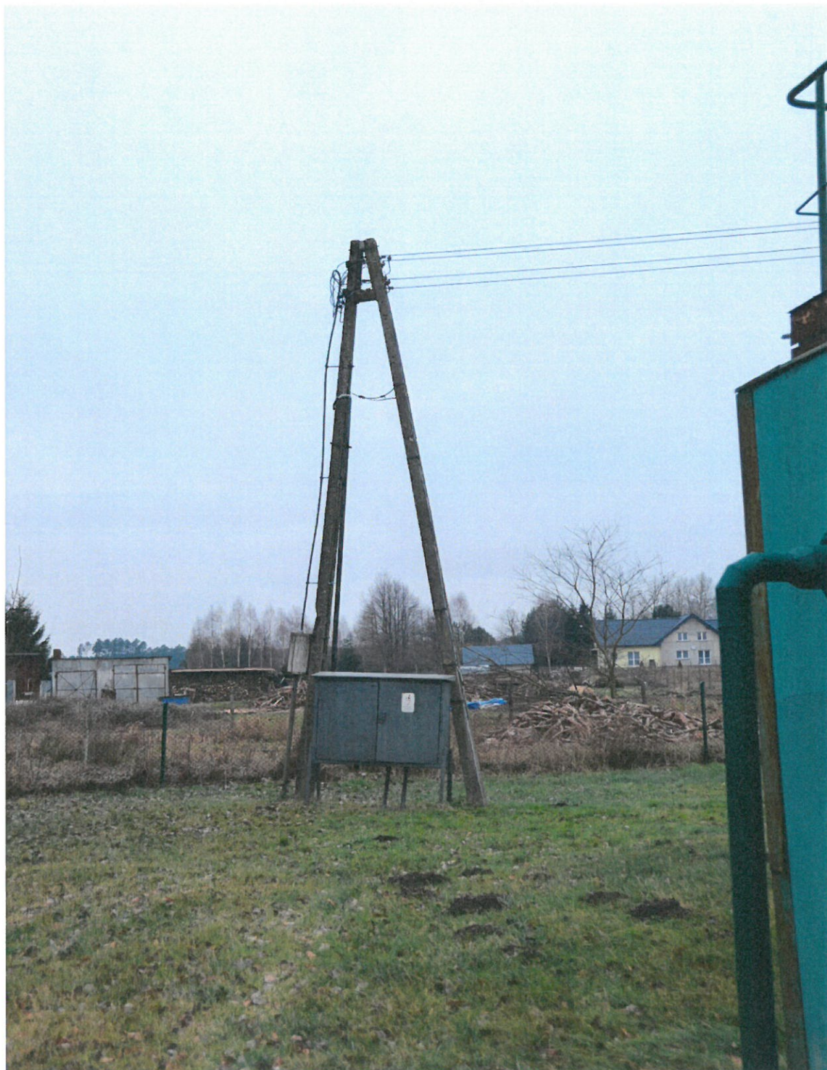
Fot. nr 9. Słup i sieć napowietrzna nn 0,4 kV na terenie działki do usunięcia