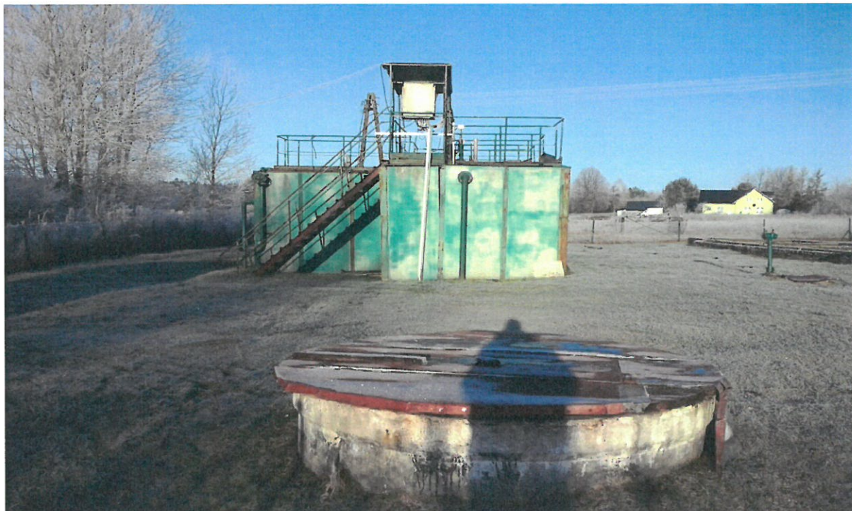
Fot. nr 3. BIOBLOK MUm75 elewacja SE oraz pompownia ścieków surowych (na pierwszym planie)