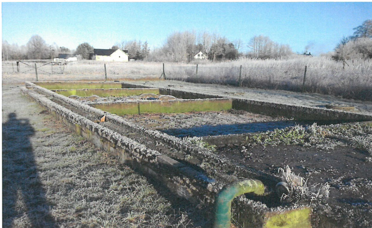
Fot. nr 7. Poletka osadowe