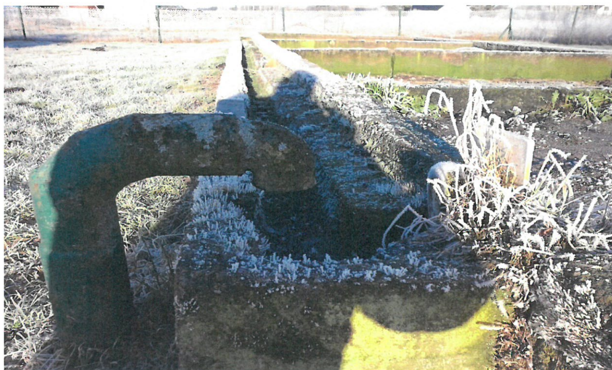
Fot. nr 8. Koryto rozdzielcze z rurą dopływu osadu